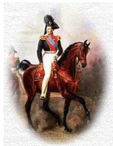
Император Николай I (1796-1855 император с 1825). Ценил исполнительность выше компетентности и предпочитал назначать на руководящие должности военных, привыкших к строгой дисциплине и беспрекословному подчинению.